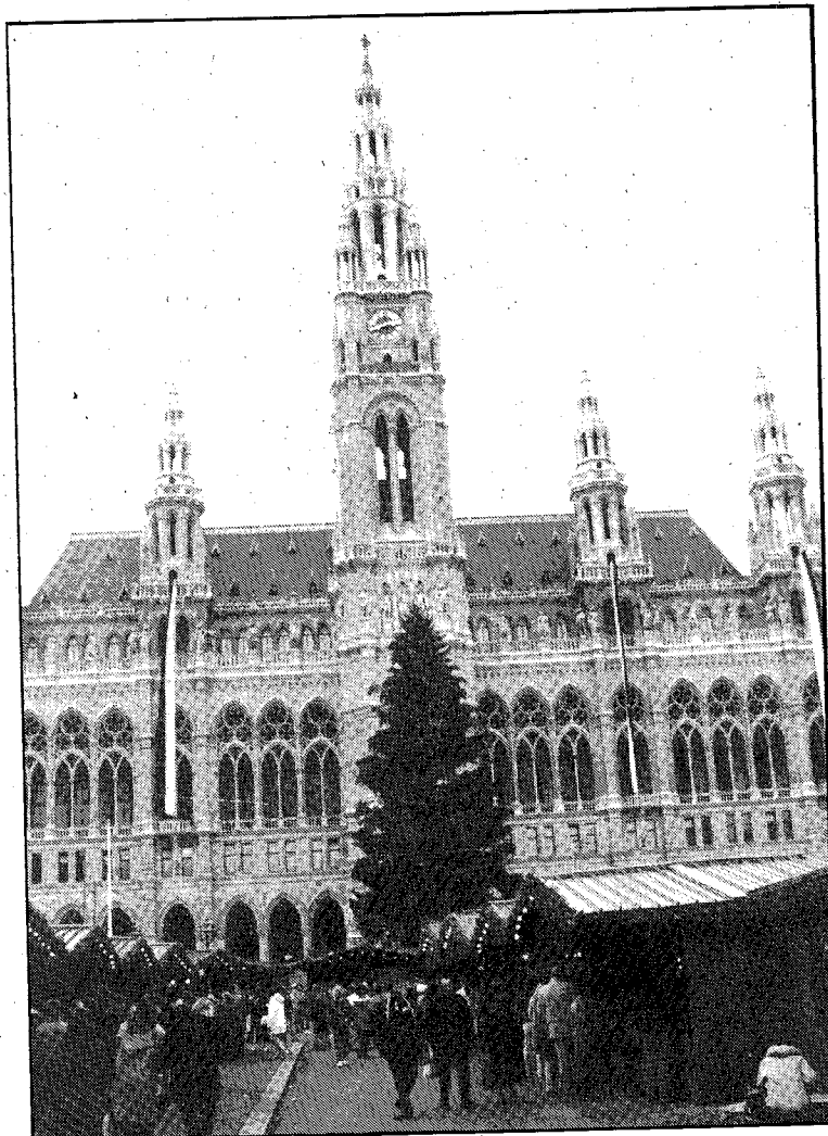
Christbaum aus Goberling vor dem Rathaus in Wien.

Besitzer von gegenständlichen Fahrzeugen werden ersucht, bis spätestens 31. Dezember 1992 dieser Bestimmung nachzukommen.